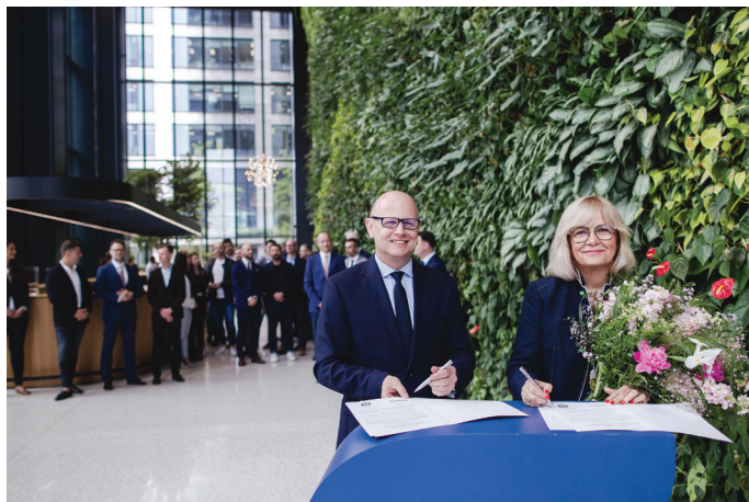
◆ Zdj. 2.

Pracownicy PZU mogą korzystać z bezpiecznej, wygodnej i funkcjonalnej przestrzeni biurowej. Do ich dyspozycji oddano nowoczesne systemy drukujące, foodomaty, relaks-roomy, siłownię, bogato wyposażone sale konferencyjne czy też kabiny